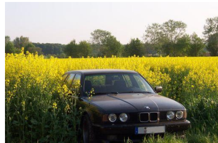
Kraft und Energie aus dem Rapsfeld Nutzung der Sonnenenergie

Pflanzenöl ist die sinnvollste Alternative zu Dieselmotorkraftstoff, Erdgas und Heizöl.